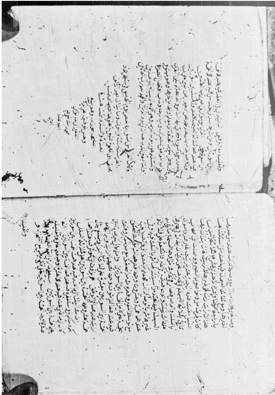
صورة الورقة الأخيرة من نسخة مكتبة جامع الشيخ (ن).