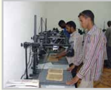
- وحدة التصوير الرقمي.