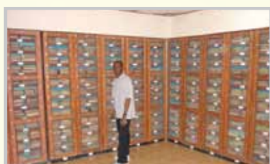
- Salle Internet