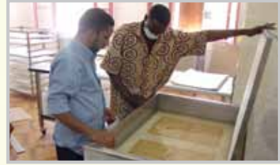
- وحدة الترميم الآلي.