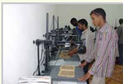
- Unité pour La photographie numérique unifiée