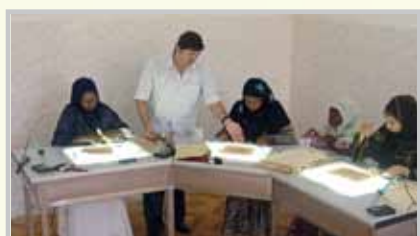
- Unité pour la restauration de manuel