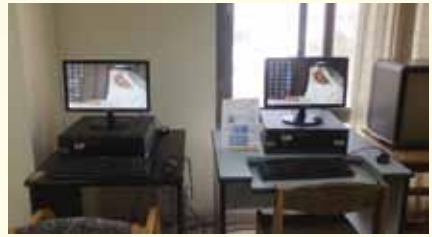
- قاعة إنترنت.