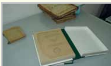
- Unité l'industrie des boîtes pour les Conservations