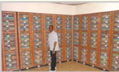
- مكتبة متنوعة.