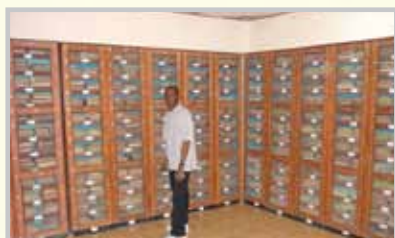
- Internet Hall.