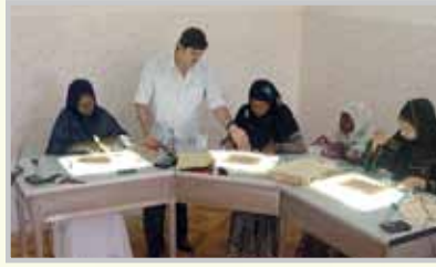
- وحدة الترميم اليدوي.