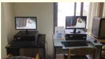
- Bibliothèque Divers