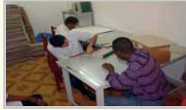
- وحدة التجليد وصناعة علب الحفظ.