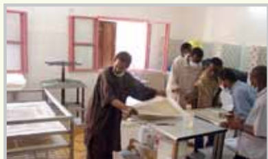
- Unité pour la restauration automatique

- Le Centre Juma Al Majid culture et du patrimoine en collaboration avec la Bibliothèque de Hydra, qui a fourni le terrain pour construire un centre intégré pour un à deux étages manuscrits de Tombouctou. Sauvegarder, il contient les modules suivants: