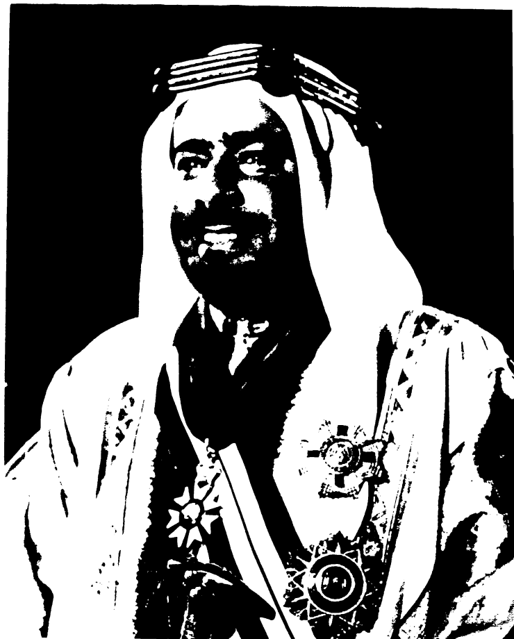
حضرة عبد الرحمن السعدي شيخنا وعلو شأنه أمه دولة