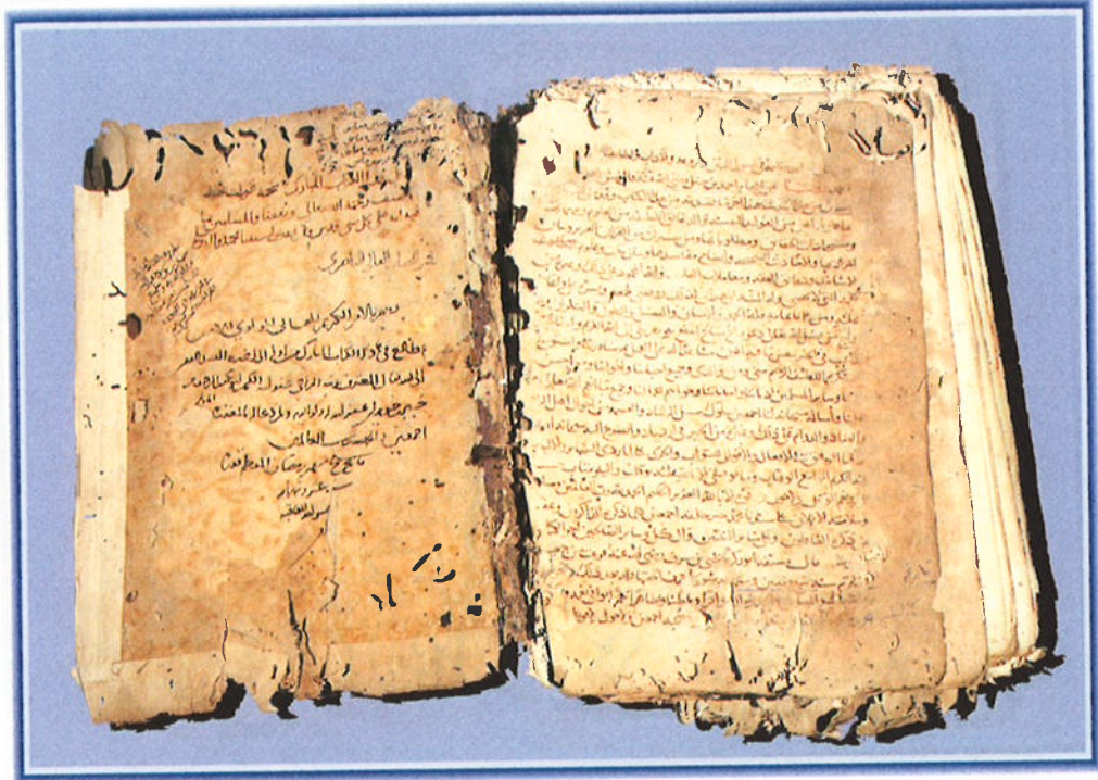
الورقة الأخيرة من مخطوطة: حلية الأبرار يظهر بها تاريخ النسخ سنة ٨١٠ هجرية