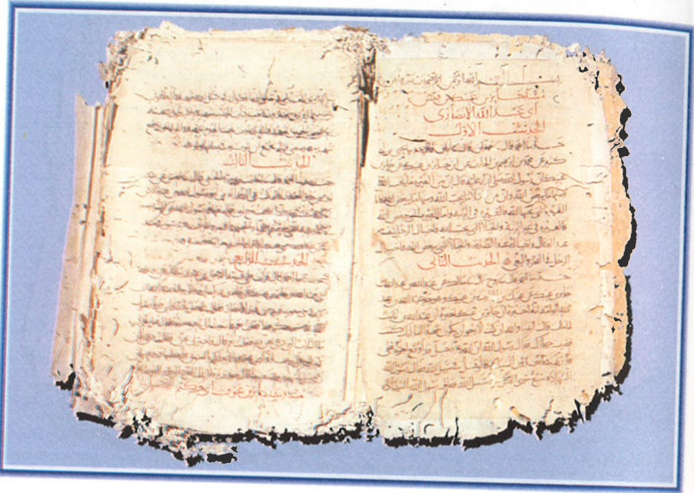
الورقة الأولى من مخطوطة