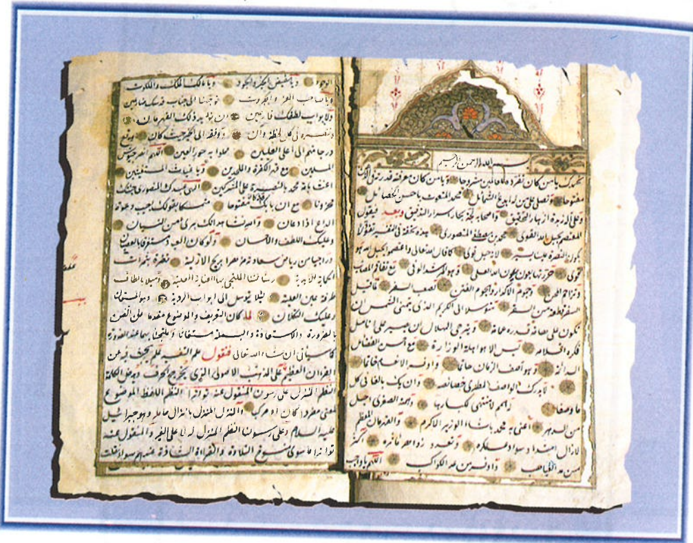
مخطوطة (تفسير الفاتحة، للمنصوري)