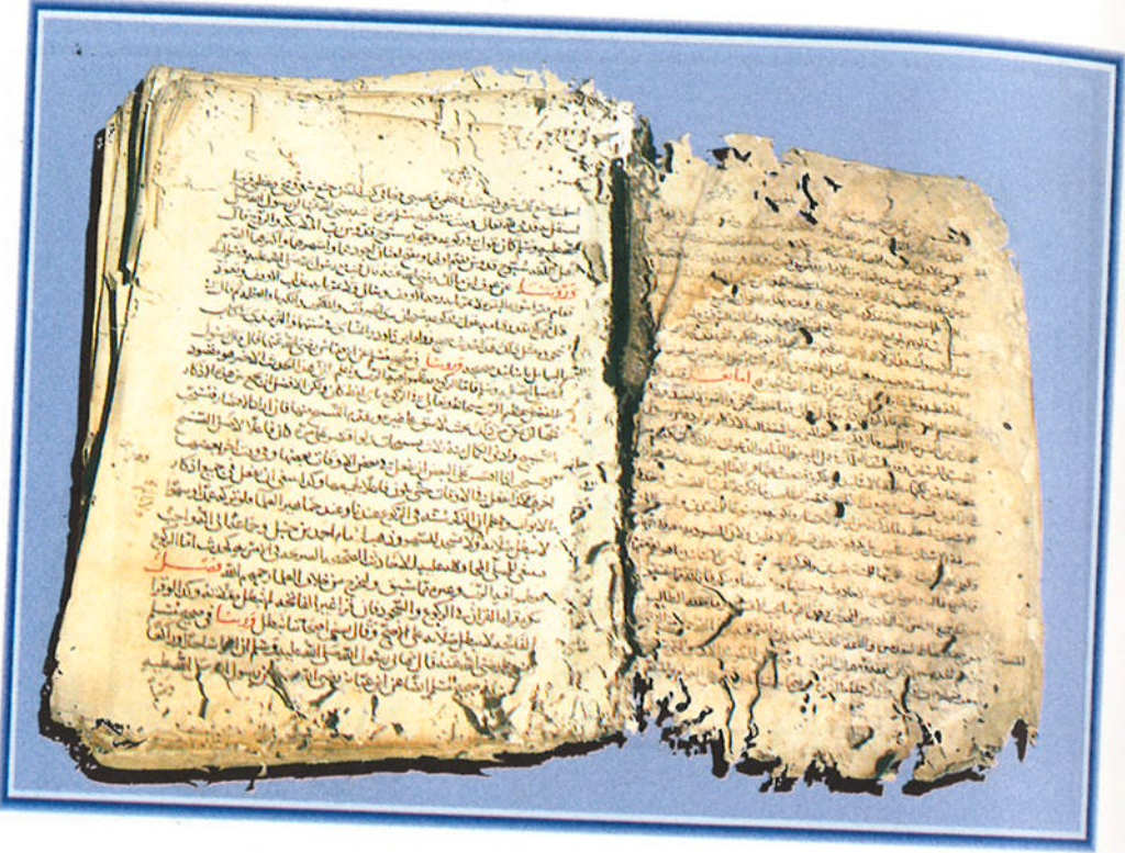
الورقة الأولى من مخطوطة