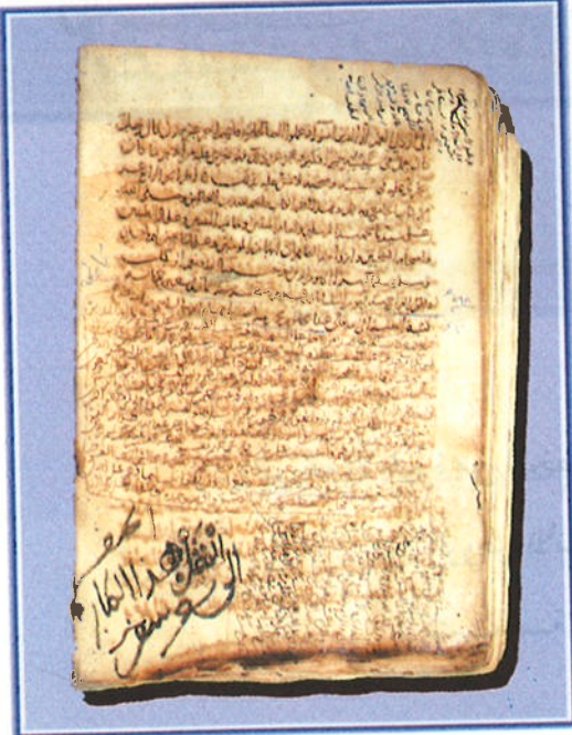
الورقة الأخيرة من المخطوطة