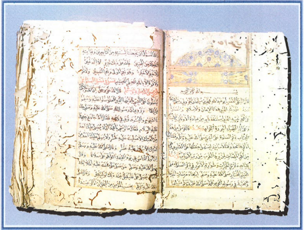
دلائل الخيرات، للجزولي مخطوطة رقم ١١٢٧ / تصوف