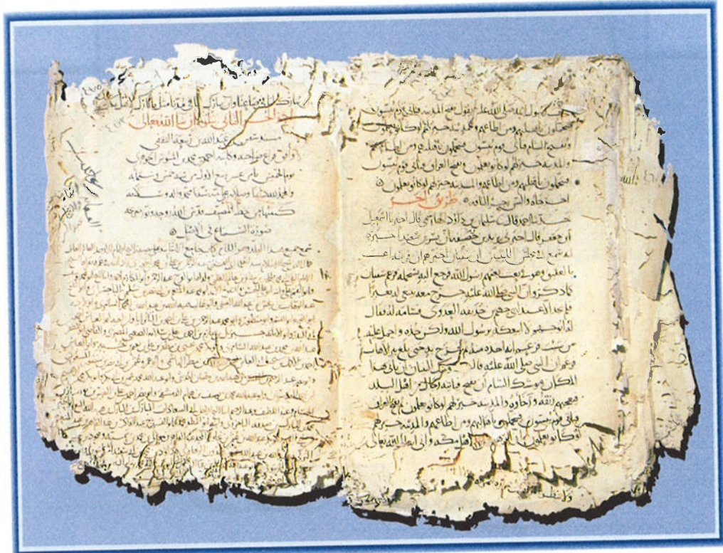
الورقة الأخيرة من المخطوطة رقم ٢٦٧ / حديث