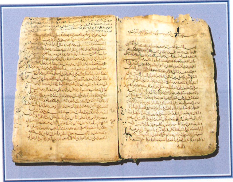
الورقة الأولى من مخطوطة رقم ١٨٣ / حديث