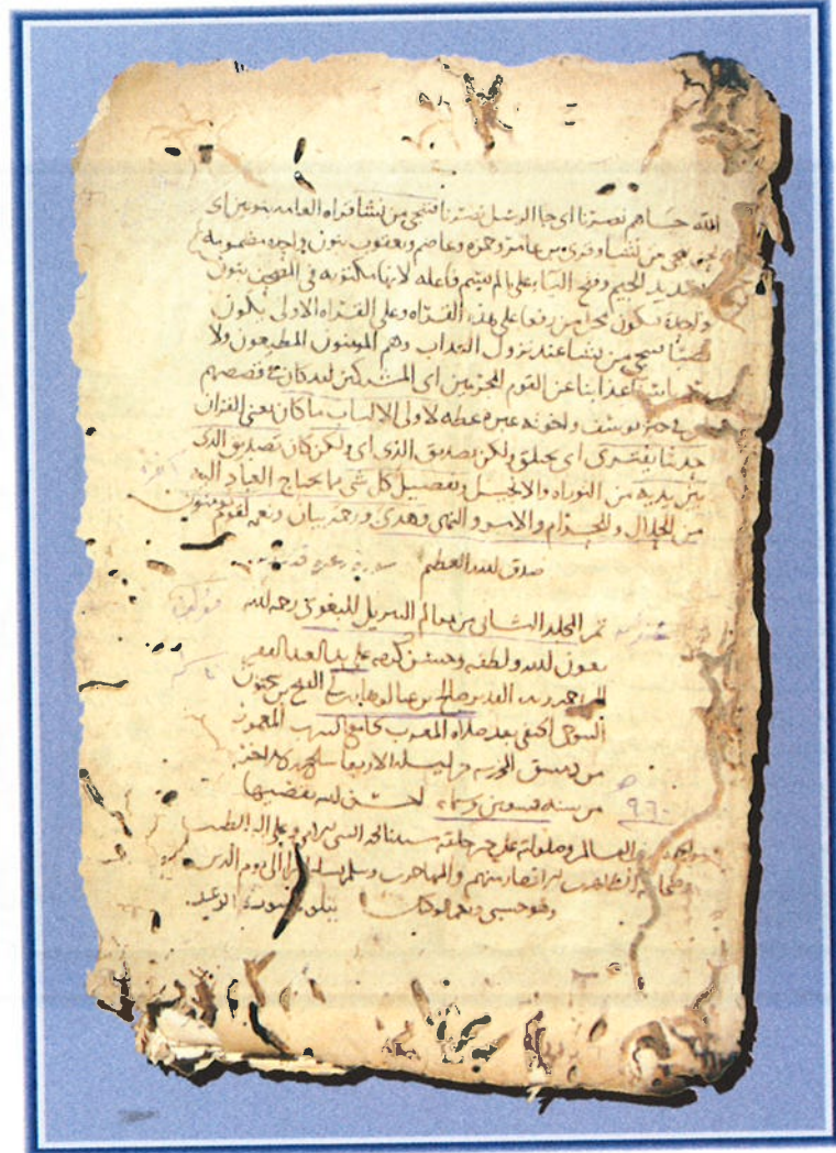
الورقة الأخيرة من المخطوطة رقم ١٤٩ / تفسير (معالم التنزيل، للبعوي) يظهر بها تاريخ النسخ: ٦٩٠ هجرية