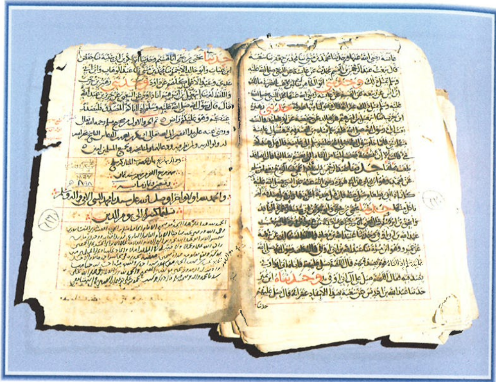
صحيح مسلم الورقة الأخيرة من المخطوطة رقم ٢١٢ / حديث (كتبت سنة ٨٩٨ هجرية)