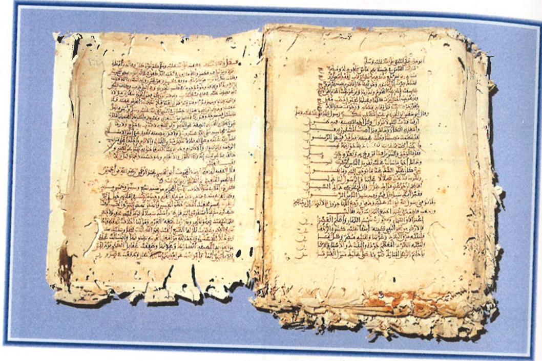
الورقة الأخيرة من المخطوطة رقم ١٥٩٤ / سيرة