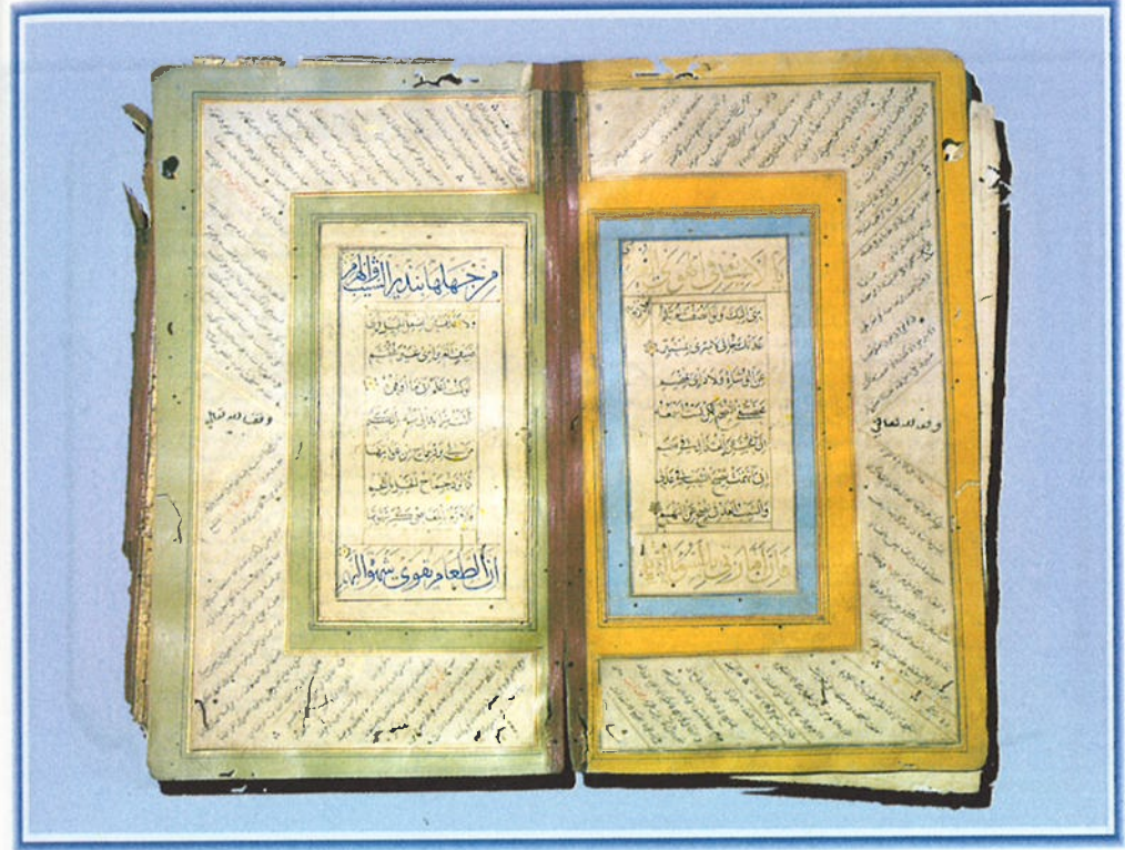
مخطوطة (البردة، للبوصيرى)